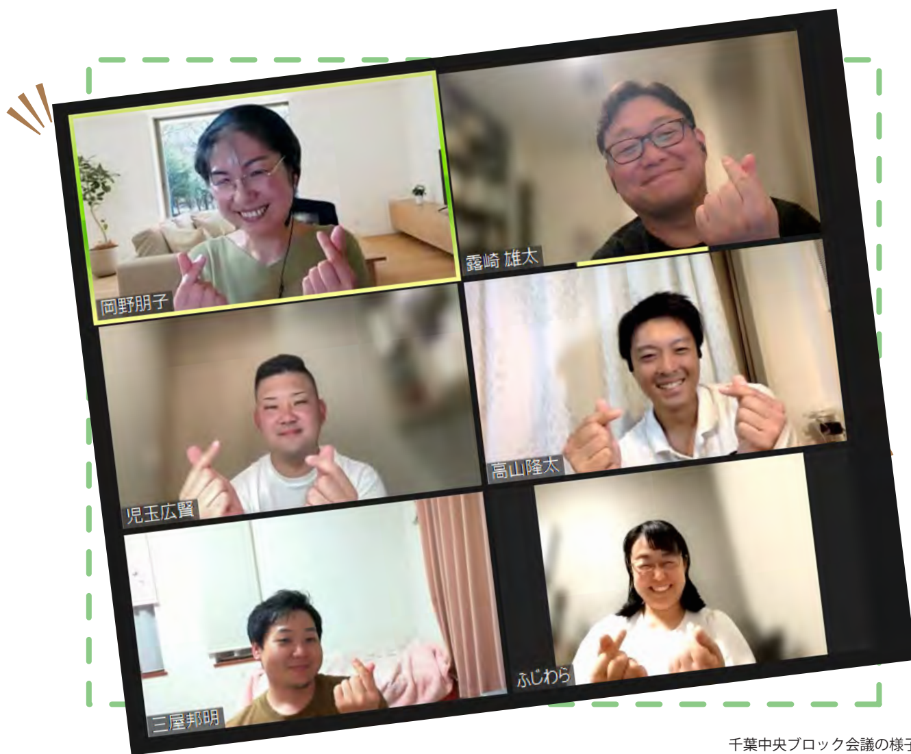
千葉中央ブロック会議の様子