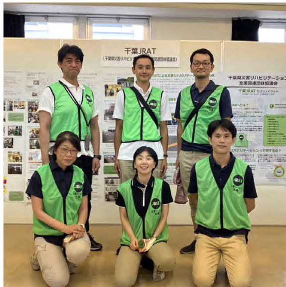
当日の参加スタッフ