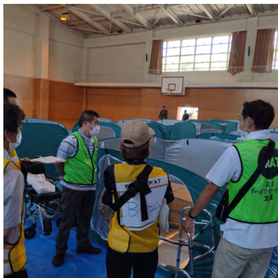
DWAT との避難所アセスメントの様子