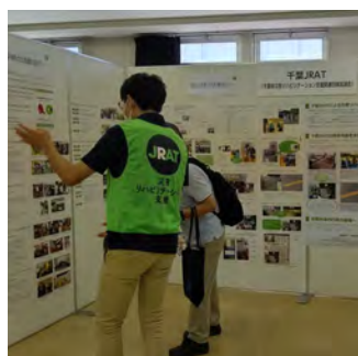
千葉 JRAT ブースの様子