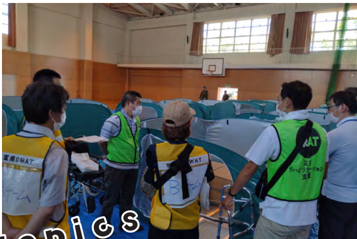
災害対策委員会 9都市合同防災訓練に参加しました!!