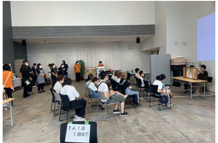
東総ブロック 認知症啓発イベントに参加しました!!