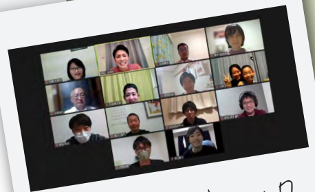
東葛南部ブロッグ