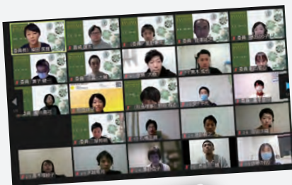
老年期障害委員会

Chiba Association of Occupational Therapists News