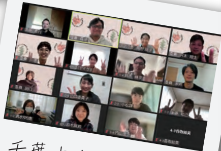
千葉中央ブロッグ