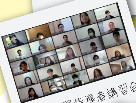
臨床実習指導者講習会